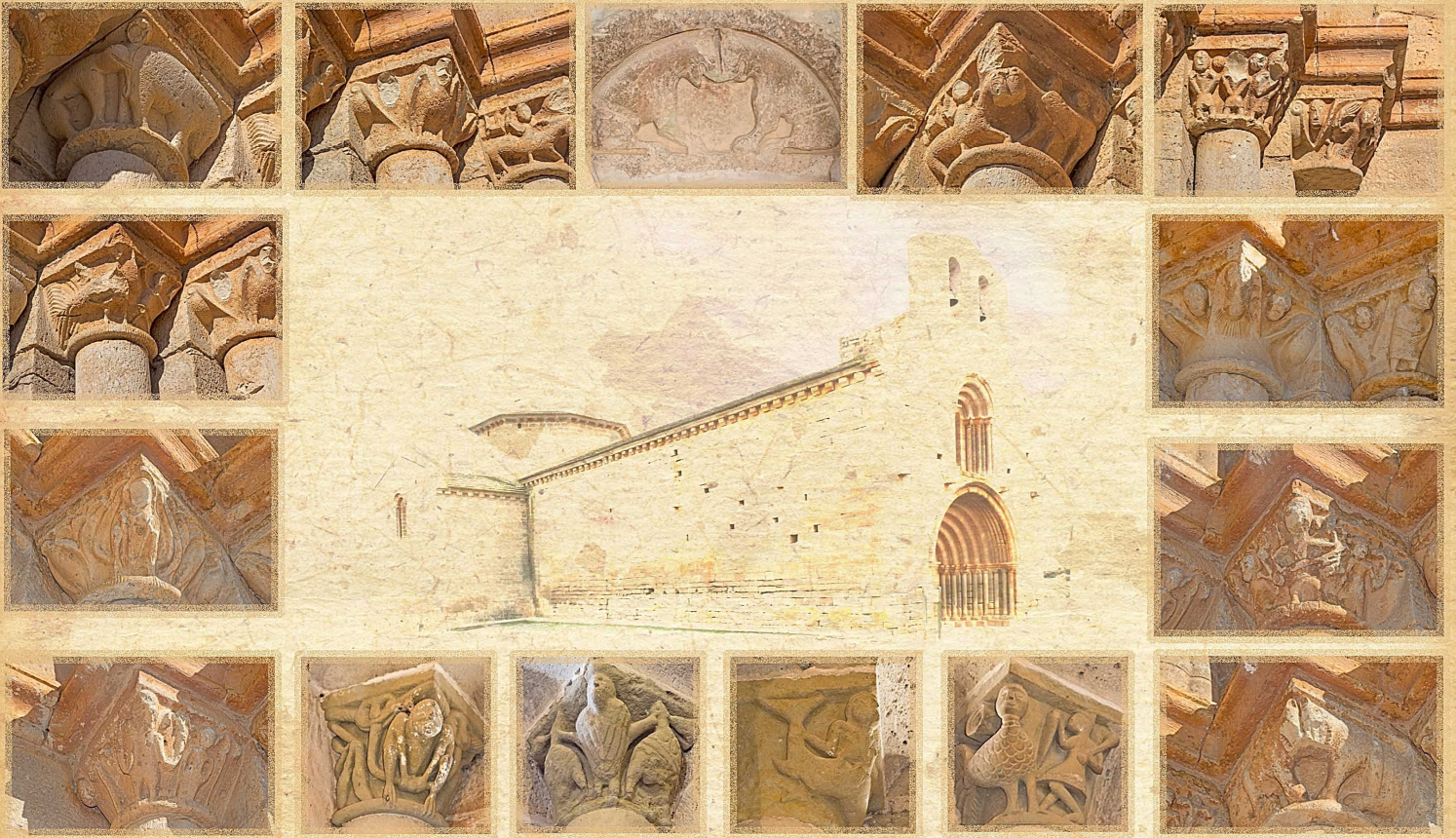
Ermita romànica de Santa Maria de Xalamera. Finals del segle XII. Detall dels capitells que representen escenes amb animals, figures humanes i mitològiques, i sobre els que hi ha diferents teories interpretatives.