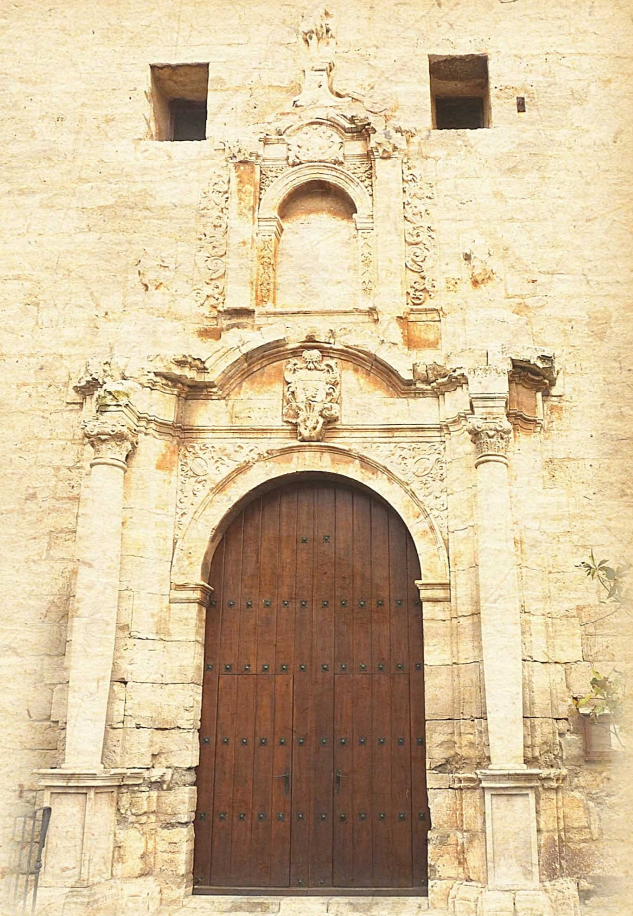
Façana de l'església de Sant Joan Baptista, d'estil barroc. Segle XVIII.