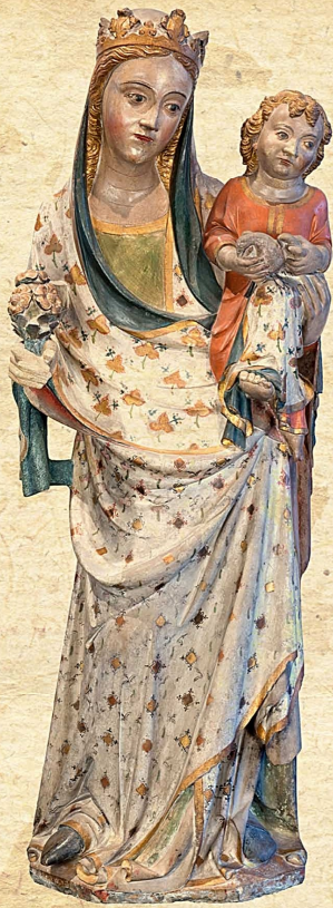
Mare de Déu de Saidí. Segle XIV, gòtic. Taller de Bartomeu de Robió. Pedra policromada. (Museu de Lleida Diocesà i Comarcal)