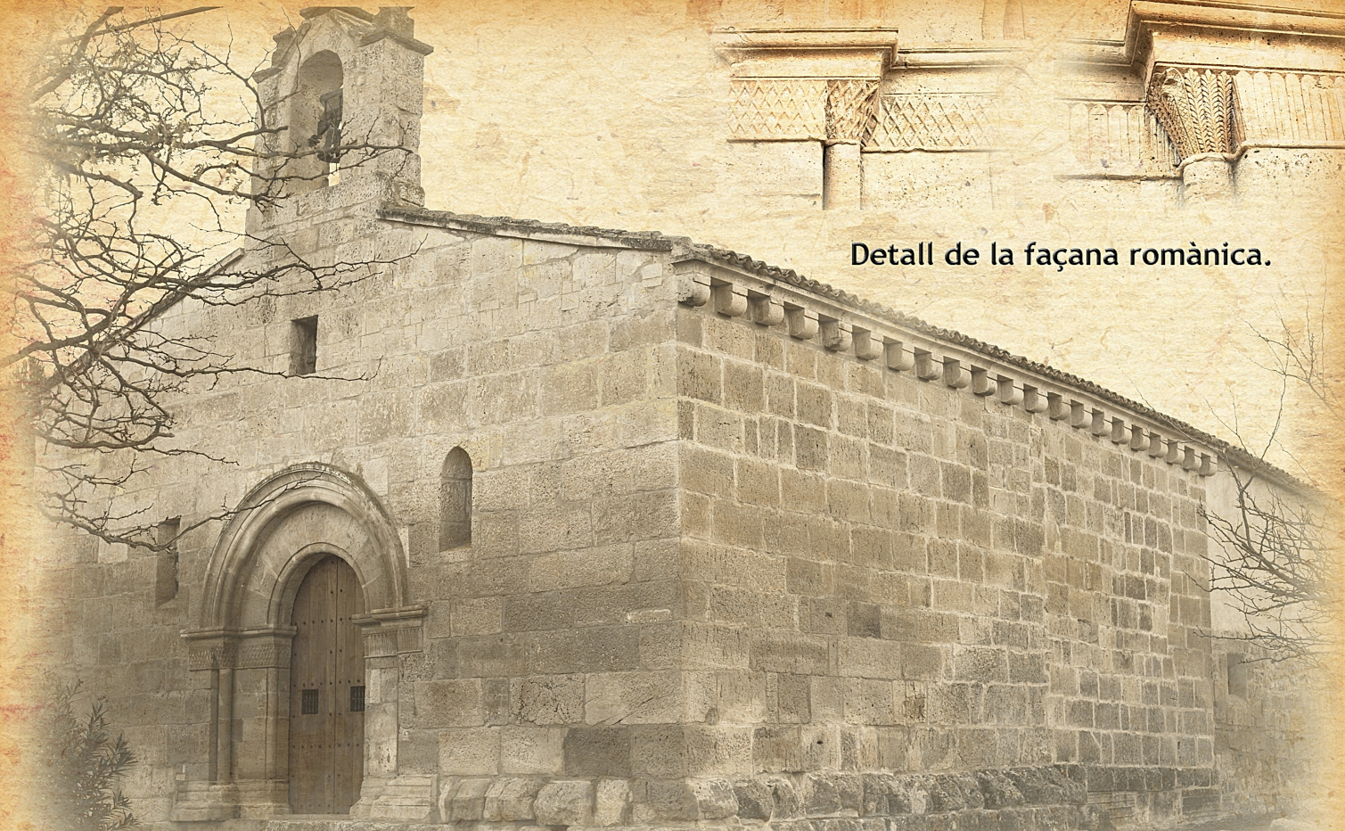
Detall de la façana romànica.

Ermita romànica de Sant Valero, Vilella de Cinca. Segle XIII. Construïda sobre un mausoleu romà del segle I, és d'orientació litúrgica invertida, és a dir, d'oest a est. De l'època romana es conserven el podium , una part dels murs i dos capitells molt desfigurats que es van trobar al voltant.