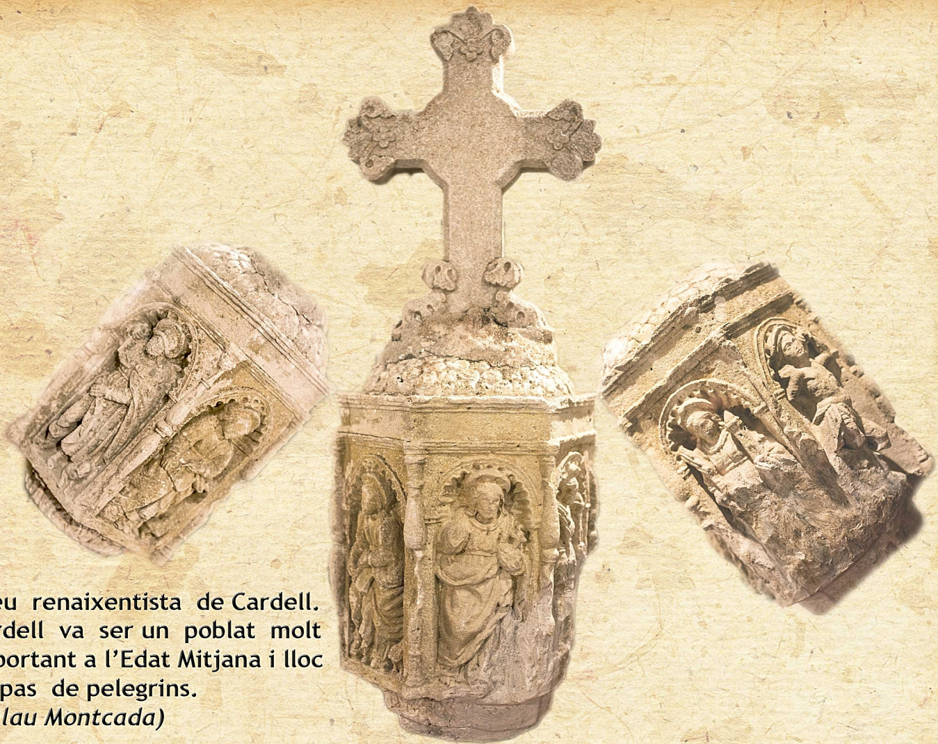
Creu renaixentista de Cardell. Cardell va ser un poblat molt important a l'Edat Mitjana i lloc de pas de pelegrins. (Palau Montcada)