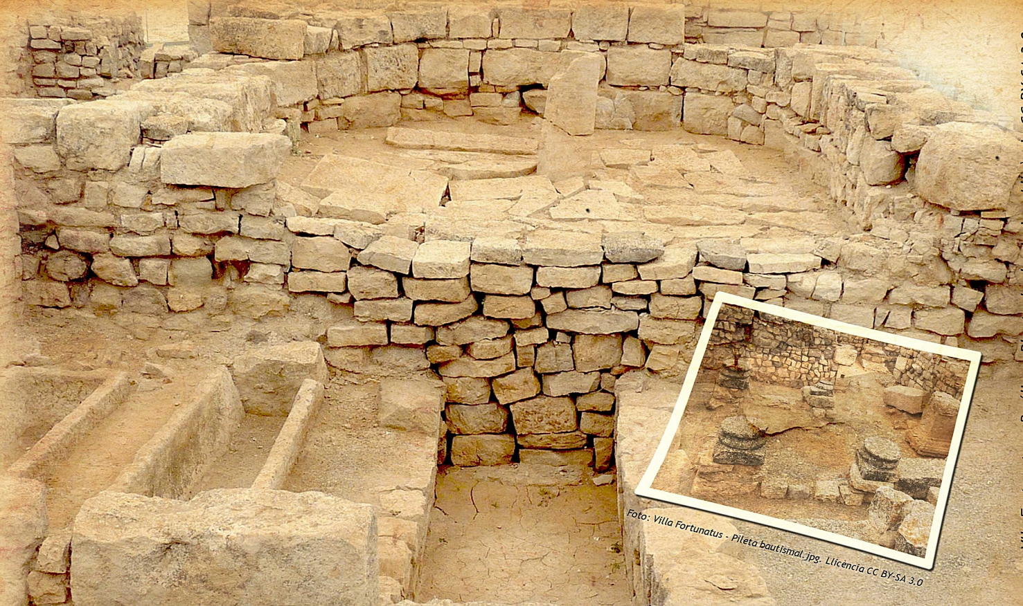
Vila Fortunatus - Basílica - Planta desde pie.jpg. Llicència CC BY-SA 3.0