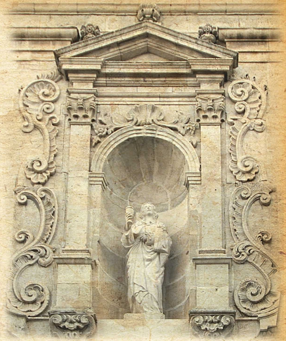
Façana de l'església parroquial de Torrent de Cinca, dedicada a Santa Maria Magdalena. S. XVIII, d'estil barroc xurrigueresc. L'anterior va ser incendiada durant el transcurs de la Guerra de Successió (1701-1714).